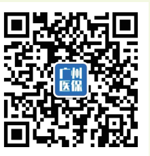
广州医保微信公众号

温馨提示：本资料内容如果与政策文件有出入或政策发生调整，请以最新公布的政策为准。